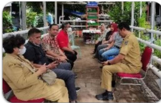
Gambar 2. Diskusi intensif dengan para stake holder dari KRPL Segaran Asri Tambakrejo yang dilakukan di kebun hidroponik milik KRPL

Metode yang digunakan dalam kegiatan PKM oleh penulis adalah metode ABCD ( Asset Based Community Development ) yang berfokus pada pemberdayaan masyarakat melalui pemahaman terhadap potensi maupun permasalahan/hambatan yang ada guna meningkatkan kualitas dari kelompok masyarakat tersebut (McKnight & Russell, 2018; Selasi et al., 2021). Untuk menggali informasi lebih dalam terkait potensi dan permasalahan yang dihadapi oleh KRPL Segaran Asri Tambakrejo, dilakukan diskusi intensif dengan semua stake holder dari KRPL Segaran Asri yang meliputi pengurus KRPL, ketua RT/RW, serta perangkat kelurahan (Lurah Tambakrejo). Gambar 2 menunjukkan situasi ketika dilakukan diskusi intensif antara tim PKM dengan para stakeholder tersebut.