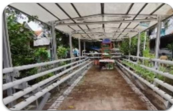
Gambar 1. Kondisi awal kebun hidroponik milik KRPL Segaran Astri Tambakrejo Kota Surabaya. Area kosong di tengah kebun lebih difungsikan sebagai tempat berkumpul warga

Ketika pertama kali kebun hidroponik milik KRPL tersebut dibuat tahun 2018, para anggota KRPL hanya berorientasi pada kerja mandiri dan hasil panen nya dinikmati sendiri dan/atau dibagikan pada warga sekitar kebun. Kegiatan pengelolaan kebun hidroponik tersebut dilakukan para anggota KRPL dengan jadwal seadanya, mengikuti kesibukan dari para ibu-ibu anggota KRPL tersebut. Kendala-kendala yang dihadapi warga dan anggota KRPL dalam mengelola kebun hidroponik tersebut dapat dikelompokkan menjadi dua aspek utama, yaitu aspek produksi dan aspek pemasaran.