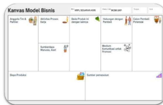
Gambar 4. Desain BMC yang dilatihkan kepada anggota KRPL untuk menggali potensi marketing dan profit-nya dari hasil kebun hidroponik yang sudah direvitalisasi.

Untuk solusi terkait strategi pemasaran hasil panen, tahapan-tahapan kegiatannya adalah sebagai berikut. Pertama, tim PKM merancang metode dan mekanisme pelatihan tentang metode pemasaran yang strategis dan berdampak besar berdasarkan mekanisme yang sudah pernah dilakukan sebelumnya (Telaumbanua et al., 2020). Gambar 4 menunjukkan blueprint dari analisa potensi yang akan dituangkan dalam bentuk BMC ( business model canvas ).