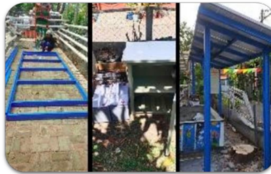
Gambar 5. Proses instalasi pembangkit listrik tenaga surya (PLTS) yang dipasang di KRPL Segaran Asri.

Untuk mengevaluasi dan menguji kinerja dari PLTS tersebut dilakukan serangkaian pengukuran dan pengujian seperti ditunjukkan pada Gambar 6. Pengujian PLTS meliputi response time saat dinyalakan dan dimatikan serta pengujian terhadap gangguan seperti short circuit dan overload . Sedangkan pengukuran parameter kelistrikan PLTS meliputi pengukuran tegangan dan daya yang dihasilkan oleh PLTS tersebut.