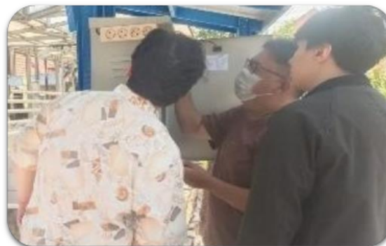
Gambar 6. Proses pengujian performa pembangkit listrik tenaga surya (PLTS) di KRPL Segaran Asri.

Untuk mengevaluasi dan menguji kinerja dari PLTS tersebut dilakukan serangkaian pengukuran dan pengujian seperti ditunjukkan pada Gambar 6. Pengujian PLTS meliputi response time saat dinyalakan dan dimatikan serta pengujian terhadap gangguan seperti short circuit dan overload . Sedangkan pengukuran parameter kelistrikan PLTS meliputi pengukuran tegangan dan daya yang dihasilkan oleh PLTS tersebut.