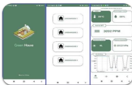
Gambar 8. Purwarupa program aplikasi berupa dashboard untuk memantau dan mengendalikan sistem IoT kebun hidroponik seperti ditunjukkan pada gambar 7.

Purwarupa seperti ditunjukkan pada Gambar 7 dan Gambar 8 telah diuji coba secara langsung yang hasilnya ditunjukkan pada Tabel 5.