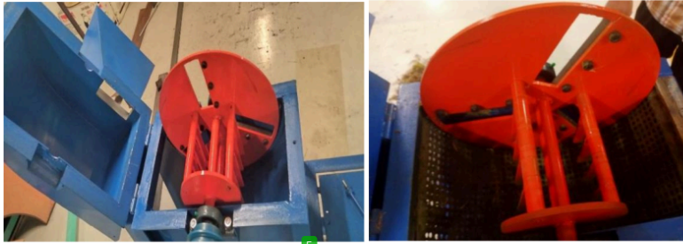
Gambar 4. Pisau pemotong yang perlu mendapat perhatian dan perawatan khusus

Material yang terlalu basah dapat menyebabkan penyumbatan pada mesin, sementara material yang terlalu kering dapat menghasilkan debu yang mengganggu dan meningkatkan risiko kerusakan komponen mesin. Pengoperasian mesin melebihi kapasitasnya juga dapat menyebabkan beban berlebih yang berdampak buruk pada performa dan umur mesin. Oleh karena itu, perawatan rutin, seperti pelumasan dan pengecekan komponen penting sangat krusial untuk memastikan mesin tetap berjalan optimal (Dahlia, 2022). Selain itu, getaran berlebihan yang disebabkan oleh ketidakseimbangan pemasangan komponen dan ausnya bagian, seperti belt atau pulley dapat mengganggu kinerja mesin. Dengan melakukan perawatan yang baik dan menggunakan mesin sesuai dengan kapasitas yang dianjurkan, masalah-masalah tersebut dapat dihindari.