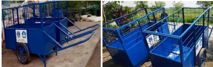
Gambar 3. Penambahan 2 unit gerobak sampah sebagai sarana pendukung

menunggu jadwal pengangkutan akibat keterbatasan fasilitasnya telah ditindaklanjuti dengan penyumbangan dua buah gerobak sampah ukuran 170x80x115cm sebagaimana ditunjukkan dalam Gambar 3. Gerobak sampah yang diberikan ini tidak hanya membantu mengatasi kendala jadwal pengangkutan yang terhambat, tetapi juga mampu menjangkau area yang sulit dijangkau oleh kendaraan pengumpul karena sifatnya yang fleksibel. Dengan demikian, efisiensi dalam proses pengumpulan sampah dapat tercapai (Riza dkk., 2023). Tim abdimas dan mitra juga sempat merencanakan beberapa inovasi untuk gerobak sampah ini, termasuk pemanfaatan sepeda berbasis energi terbarukan sebagai penggerak gerobak. Namun, rencana tersebut belum dapat direalisasikan karena keterbatasan waktu pelaksanaan kegiatan abdimas.