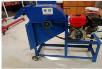
Gambar 1. Komponen penyusun mesin pencacah bahan organik desa Mojotrisno

Keberadaan mesin pencacah bahan sampah organik yang baru sangat penting, terutama karena mesin yang lama sudah tua dan sering mengalami masalah saat proses pencacahan (Siahaan dkk., 2023b). Hal ini bisa mengakibatkan kebutuhan waktu dan tenaga yang lebih banyak sehingga mengurangi efisiensi keseluruhan dalam mengolah bahan sampah organik yang masuk ke TPS3R. Dalam proses pembuatan mesin pencacah ini, dirancang opsi tambahan sehingga mesin tidak hanya berfungsi untuk membuat kompos, tetapi juga bisa digunakan untuk mencacah bahan pakan ternak. Hal ini yang menjadi keunggulan mesin pencacah ini dibandingkan dengan yang lain. Dengan adanya mesin pencacah, program pengelolaan sampah di Desa Mojotrisno diharapkan berjalan lebih efektif (Astuti dkk., 2014). Masyarakat pun semakin sadar akan pentingnya mengelola sampah dengan cara yang lebih ramah lingkungan (Ayu dkk., 2020). Gambar 2 memperlihatkan pengolahan bahan sampah organik menggunakan mesin lama dan mesin baru.