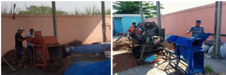
Gambar 2. Pengolahan bahan sampah organik mesin lama vs mesin baru

Keberadaan mesin pencacah bahan sampah organik yang baru sangat penting, terutama karena mesin yang lama sudah tua dan sering mengalami masalah saat proses pencacahan (Siahaan dkk., 2023b). Hal ini bisa mengakibatkan kebutuhan waktu dan tenaga yang lebih banyak sehingga mengurangi efisiensi keseluruhan dalam mengolah bahan sampah organik yang masuk ke TPS3R. Dalam proses pembuatan mesin pencacah ini, dirancang opsi tambahan sehingga mesin tidak hanya berfungsi untuk membuat kompos, tetapi juga bisa digunakan untuk mencacah bahan pakan ternak. Hal ini yang menjadi keunggulan mesin pencacah ini dibandingkan dengan yang lain. Dengan adanya mesin pencacah, program pengelolaan sampah di Desa Mojotrisno diharapkan berjalan lebih efektif (Astuti dkk., 2014). Masyarakat pun semakin sadar akan pentingnya mengelola sampah dengan cara yang lebih ramah lingkungan (Ayu dkk., 2020). Gambar 2 memperlihatkan pengolahan bahan sampah organik menggunakan mesin lama dan mesin baru.