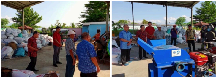
Gambar 5. Pelatihan dan pendampingan mitra Desa Mojotrisno

Hasil dari pelatihan dan pendampingan ini berupa peningkatan keterampilan ( skill ) mitra atau kelompok masyarakat, terutama dalam mengoperasikan atau membuat mesin pencacah bahan sampah organik, pemahaman lebih mendalam tentang pengelolaan sampah, serta terbentuknya kemampuan untuk mengaplikasikan pengetahuan tersebut secara mandiri dalam lingkungan kerja atau komunitas setempat. Selain itu, pelatihan ini juga dapat menghasilkan dokumentasi teknis dan panduan operasional yang dapat digunakan peserta di kemudian hari. Kegiatan pelatihan dan pendampingan di TPS3R ditunjukkan sebagaimana dalam Gambar 5.