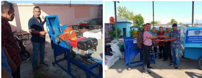
Gambar 7. Penutupan kegiatan pelatihan demonstrasi mesin kompos dan pendampingan

Di akhir kegiatan pelatihan dan pendampingan, dilakukan sesi foto bersama serta penyerahan materi atau dokumen kepada Bapak Kepala Desa Bapak Nanang Sugiarto dan tim mitra yang diwakili oleh Bapak Pilipus Sunarno agar pelaksanaan selanjutnya dapat dilakukan secara mandiri di lokasi TPS3R. Apabila di kemudian hari terdapat permasalahan, pelatihan lanjutan serupa akan diberikan jika diperlukan. Dokumentasi kegiatannya diperlihatkan dalam Gambar 7.