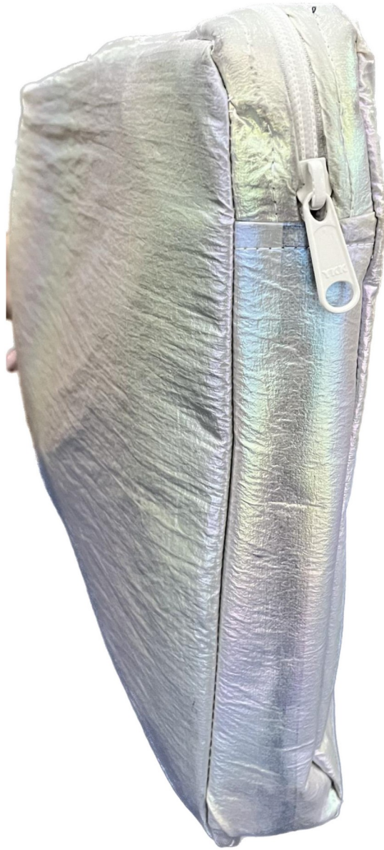
Gambar 3 - Tampak Bawah