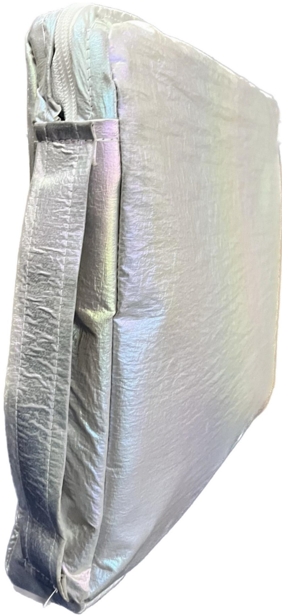
Gambar 4 - Tampak Atas