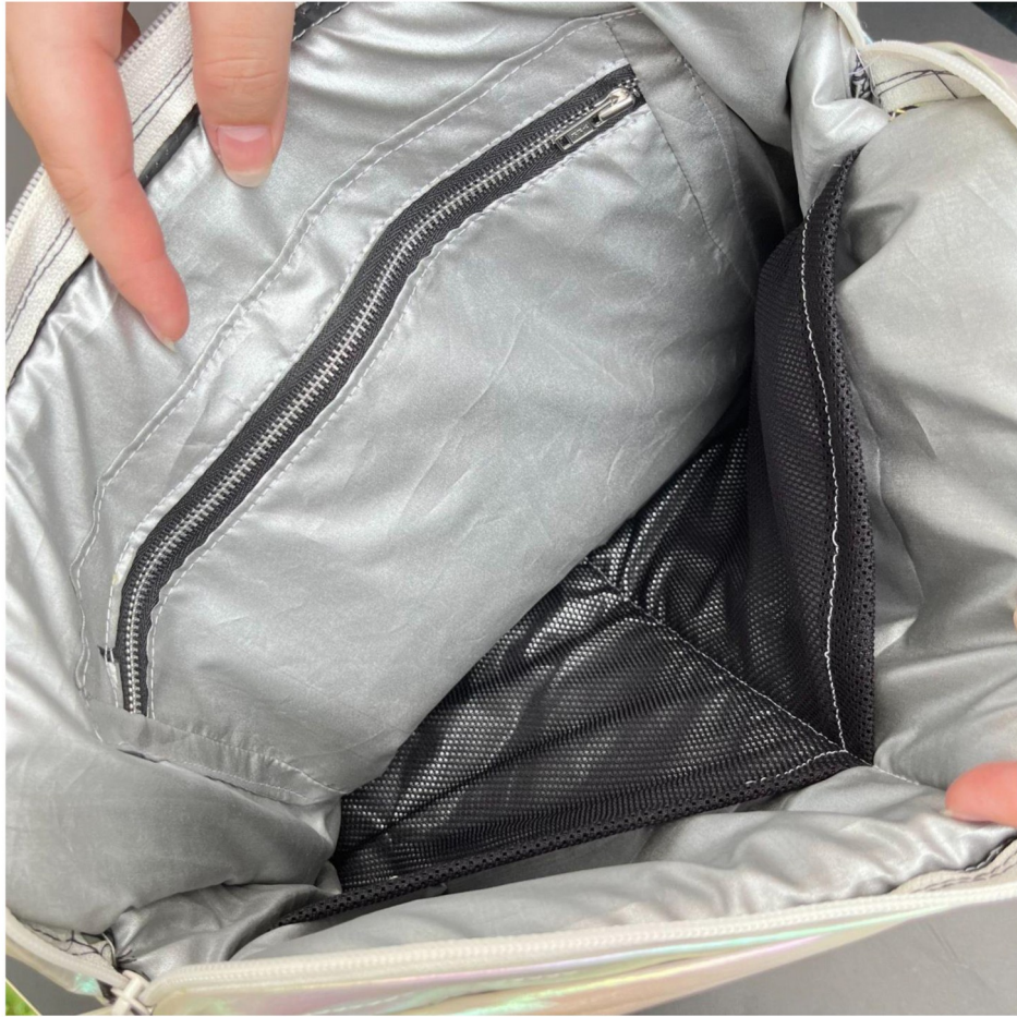
Gambar 5 - Gambar Lainnya