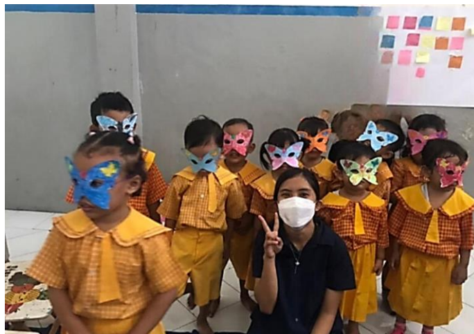
Gambar 2. Kegiatan setelah bercerita

Para siswa terlihat sangat antusias dengan flashcard yang diberikan karena ini gambar yang jelas dan berwarna. Dapat disimpulkan bahwa penerapan media gambar untuk bercerita merupakan metode yang menarik dan sangat relevan diterapkan untuk pembelajaran AUD. Gambar 2 menunjukkan salah satu kegiatan setelah bercerita di hari ketiga yaitu membuat topeng dengan motif kupu – kupu.