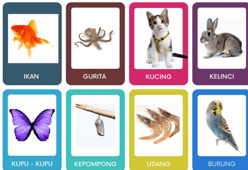
Gambar 1. Flashcard

Seperti yang sudah diuraikan dalam penjelasan literatur, flashcard adalah kartu yang memuat gambar atau foto dari materi yang akan dipelajari, dan dilengkapi dengan kata yang sesuai dengan gambar tersebut (Komachali & Khodareza, 2012). Flashcard dianggap sebagai media yang efektif dan sudah terbukti manfaatnya dalam meningkatkan minat baca dan mendengarkan cerita pada anak usia dini. Flashcard