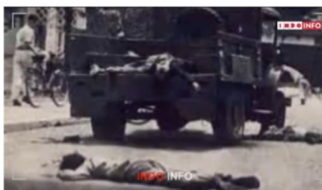
Kisah TNI Kebal Peluru, Kehebatan Letnan Komarudin Pada Serangan Umum 1 Maret

Fenomena yang makin menunjukkan makna retrogresif terdapat pada petikan gambar dari video unggahan INDOINFO di Youtube yang terdapat pada Gambar 5. Disana terdapat dokumentasi yang memperlihatkan beberapa mayat korban pemberontakan APPRA Bandung dengan teks Letnan Komarudin yang kebal peluru. Foto ini tidak sesuai dengan konteks peristiwa dan time frame , sebab menggunakan kalimat yang masih berkaitan dengan Letnan Komarudin, namun ilustrasi visual berasal dari foto dokumentasi sejarah peristiwa Pemberontakan Angkatan Perang Ratu Adil (APRA) pimpinan Westerling yang salah satunya terjadi di Bandung pada 23 Januari 1950.