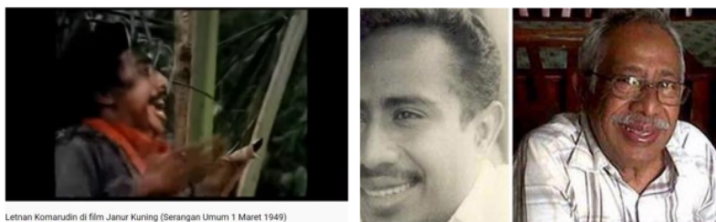
Gambar 3b. Visualisasi figur Letnan Komarudin menggunakan figur artis Amak Baldjun, pemeran sosok letnan Komarudin dalam film Janur Kuning (Alam Surawidjaja, 1979).

Scene yang memperlihatkan sosok Letnan Komarudin tidak diambil dari dokumentasi sejarah yang memperlihatkan foto-foto riil sosok sang letnan, walaupun ada beberapa dokumentasi tentang sosok riil Komarudin, namun kreator konten justru memilih menggunakan penggambaran dari figur Amak Baldjun. Hal ini dapat dimaknai ada maksud tertentu misalnya terkait popularitas atau karena sebab lain. Unikny ketika scene dari cuplikan film itu digunakan sebagai ilustrasi visual konten, kreator mengubah tampilannya menjadi hitam putih sehingga menjadi seakan-akan mengesankan dokumentasi sejarah yang otentik bukan cuplikan dari film komersial.