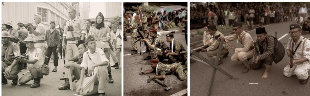
Gambar 1. Para reenactor dengan impresi pejuang dan tentara Belanda pada salah satu drama teatrical peringatan Serangan Oemoem 1949, yang dilakukan 1 Maret 2020.

Dokumentasi yang dihasilkan reenactor dan masyarakat umum menjadi sumber belajar. Ini menciptakan fenomena kontestasi pembelajaran sejarah melalui media sosial. Hal itu menjadi cara pembelajaran sejarah yang berbeda dengan media konvensional. Belajar sejarah menjadi kegairahan baru dan wacana kreatif terkait cara dan media yang digunakan. Sosok-sosok serdadu dan peralatan perang replika menjadi sumber belajar sejarah yang berbeda. Sebagai media alternatif yang bertebaran bebas di kanal atau akun-akun media sosial yang mudah diakses dan menyesuaikan kebiasaan media si pengakses.