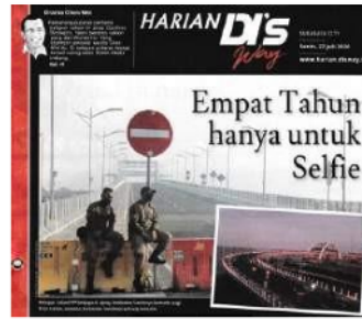
Foto 3.21. Foto Headline Harian DI's Way Senin, 27 Juli 2020 karya Adhitya Amar

Di tahap denotatif, foto ini menggambarkan dua orang petugas yang duduk di barikade, dengan jembatan sebagai latar belakangnya. Terdapat rambu berwarna merah tepat di atas kepala petugas tersebut. Ada juga foto kedua di sebelah kanan dengan menggambarkan secara luas bentuk jembatan. Terdapat caption pada foto yang bertuliskan: Petugas Satpol PP berjaga di ujung Jembatan Suroboyo kemarin pagi. Foto kanan, suasana Jembatan Suroboyo petang kemarin.