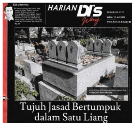
Foto 3.14. Foto Headline Harian DI's Way Sabtu, 17 Juli 2020 karya Eko Suswantoro (Sumber: Dokumentasi Pribadi)

Memasuki tahap denotatif, foto ini menggambarkan sebuah makam dengan tiga pasang batu nisan di atasnya. Makam tersebut dan makam lain di sekitarnya tampak berwarna abu-abu. Terdapat caption pada foto ini yang bertuliskan: “Nisan di Tempat Pemakaman Umum Ngagel yang diisi tiga jasad dalam satu tiang.” Terdapat seseorang menggunakan pakaian hitam yang sedang me 6 arahkan pandangannya ke makam tersebut.