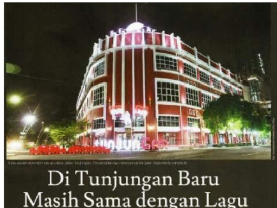
Foto 3.2. Foto Headline Harian DI's Way Minggu, 5 Juli 2020 karya Eko Suswantoro (Sumber: Dokumentasi Pribadi)

Di foto ini, tahapan denotatif menampilkan gedung Siola di Jalan Tunjungan pada malam hari. Gedung tersebut didominasi warna merah dan juga putih. Pada foto ini terdapat caption yang bertuliskan, "Siola adalah tetenger ujung utara Jalan Tunjungan. Penampilannya mempercantik jalan legendaris tersebut."