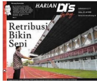
Foto 3.19. Foto Headline Harian DI's Way Sabtu, 25 Juli 2020 karya Eko Suswantoro (Sumber: Dokumentasi Pribadi)

Dalam tahap denotatif, foto ini menggambarkan seseorang yang sedang menyiram rumput, menghadap ke bagian tempat duduk/tribun lapangan. Tidak tampak orang lain di foto tersebut, selain seseorang yang sedang melakukan penyiraman. Adapun caption yang tertulis pada foto ini adalah: Petugas menyiram rumput di Lapangan THOR Surabaya. Lapangan tersebut seharusnya sudah bisa dipakai untuk berolahraga.