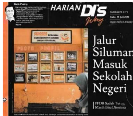
Foto 3.12. Foto Headline Harian DI's Way Selasa, 15 Juli 2020 karya Eko Suswanto (Sumber: Dokumentasi Pribadi)

Pada tahapan denotatif headline edisi ini, foto yang ditampilkan pada halaman depan ialah salah satu bagian dari SMP Bina Karya Surabaya. Terdapat beberapa foto-foto yang dipajang di dinding sekolah tersebut, dengan beberapa tulisan yang ada di sekitarnya. Ada pula seseorang sedang memegang telepon seluler melintas di depan dinding sekolah ini.