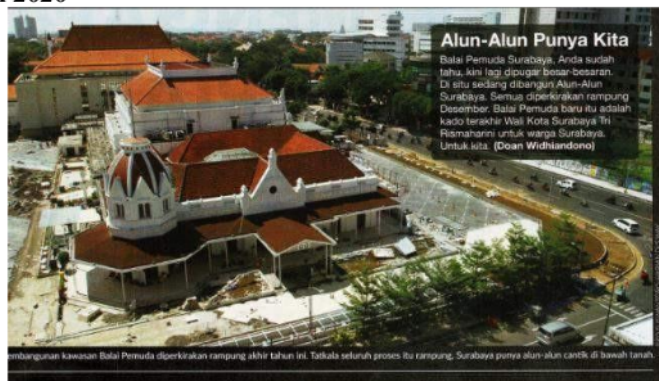
Foto 3.1. Foto headline Harian DI's Way Sabtu, 4 Juli 2020 karya Eko Suswanto (Sumber: Dokumentasi Pribadi)

Edisi ini merupakan edisi perdana dari Harian DI's Way. Dalam tahapan denotatif, foto headline edisi ini menampilkan foto gedung Balai Pemuda yang sedang direnovasi. Terdapat juga caption yang bertuliskan "Pembangunan kawasan Balai Pemuda diperkirakan rampung akhir tahun ini. Tatkala seluruh proses itu rampung, Surabaya punya alun-alun cantik di bawah tanah."