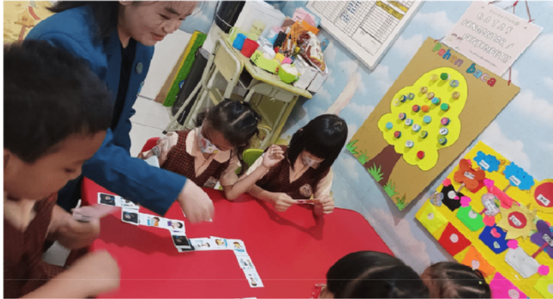
Gambar 7. Kartu domino virus keuangan

konsep dasar tentang keuangan dan pengelolaan uang. Setiap kartu domino memiliki gambar yang berhubungan dengan karakteristik perilaku keuangan, seperti boros, iri, rakus, dan malas. Dengan mencocokkan kartu-kartu ini, anak-anak tidak hanya belajar tentang hubungan antara perilaku dan keuangan, tetapi juga mengembangkan keterampilan kognitif dan pemecahan masalah.