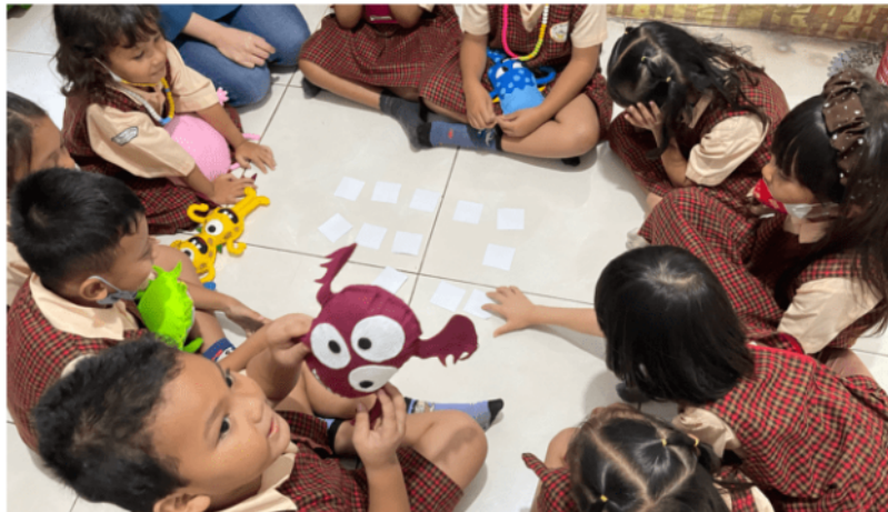
Gambar 5. Kartu kembar virus keuangan dengan metode secara bersama-sama

Selanjutnya terdapat permainan kartu kembar virus keuangan yang dilakukan dengan 2 metode, secara bersama-sama dan berkelompok. Pembagian kelompok terdiri atas 5 anggota pada setiap kelompoknya. Karena jumlah siswa-siswi TK Anak Ceria berjumlah sebanyak 10 orang, maka terdapat 2 kelompok yang ikut serta dalam permainan kartu kembar ini.