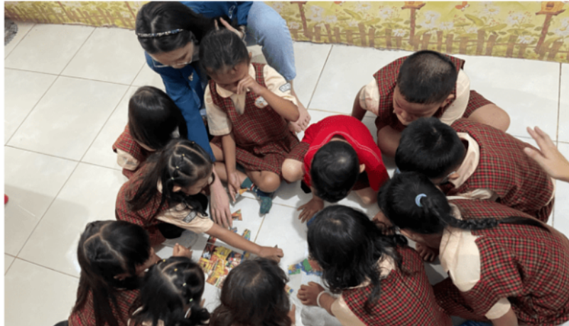
Gambar 9. Puzzle Gambar Virus Keuangan

Aktivitas keenam pada pengabdian masyarakat adalah puzzle gambar dengan tema virus keuangan. Puzzle gambar virus keuangan memberikan kesempatan bagi anak-anak untuk belajar sambil bermain agar anak-anak lebih tertarik untuk belajar. Dengan menyusun puzzle bersama, anak-anak dapat belajar cara bekerja sama dengan satu sama lain, serta memperkuat keterampilan motorik halus, koordinasi tangan-mata, dan membangun pemahaman tentang karakteristik perilaku keuangan yang penting. Selain itu, memecahkan puzzle juga melatih kemampuan pemecahan masalah dan kesabaran anak-anak.