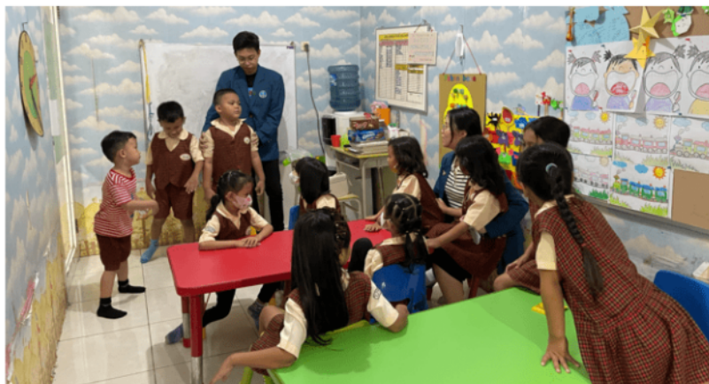
Gambar 10. Mengajak Anak-Anak untuk Bercerita tentang Pengalaman Keuangan Mereka

Aktivitas ketujuh pada pengabdian masyarakat adalah mengajak anak-anak untuk bercerita tentang pengalaman keuangan mereka. Pada hari terakhir aktivitas pengabdian masyarakat, anak-anak diajak untuk maju kedepan kelas secara bergantian untuk bercerita atau sharing tentang pengalaman keuangan mereka. Akti-