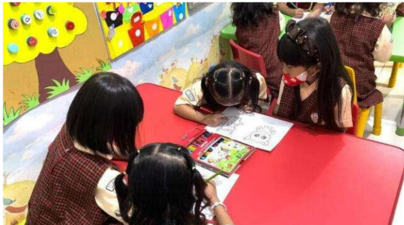
Gambar 3. Aktivitas Mewarnai Gambar Virus Keuangan

Aktivitas pertama yang dilakukan anak-anak dalam kegiatan ini adalah mewarnai gambar virus keuangan. Pada aktivitas ini, telah disediakan sebuah kertas bergambar tanpa warna sesuai dengan tokoh pada ke enam karakter boneka virus keuangan. Tujuan dilaksanakannya aktivitas mewarnai ini untuk mengasah jiwa seni anak-anak melalui pilihan gambar virus keuangan.