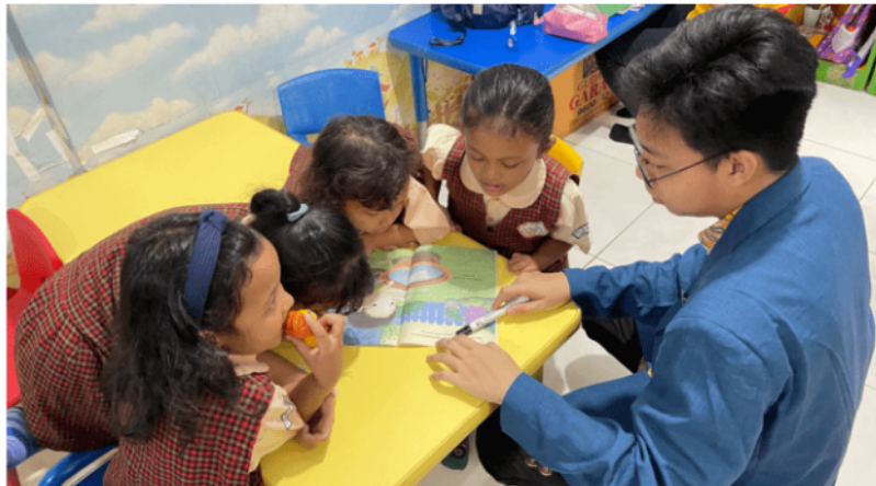
Gambar 8. Belajar Membaca Menggunakan Buku Cerita Mengenai Cara Hidup Hemat

Aktivitas kelima pada pengabdian masyarakat adalah mengajarkan anak-anak cara membaca dengan media buku cerita yang memiliki tema hidup hemat. Melalui buku cerita mengenai hidup hemat, anak-anak tidak hanya belajar cara membaca, namun anak-anak juga dapat belajar tentang betapa pentingnya menabung dan membelanjakan uang dengan bijak. Menanamkan pentingnya hidup hemat sejak dini sangatlah penting untuk masa depan anak-anak. Cerita yang menarik dari buku-buku cerita dapat membantu anak-anak memahami konsep keuangan dengan cara yang lebih mudah dan menyenangkan. Selain itu, aktivitas membaca bersama dapat membantu meningkatkan kemampuan literasi anak.