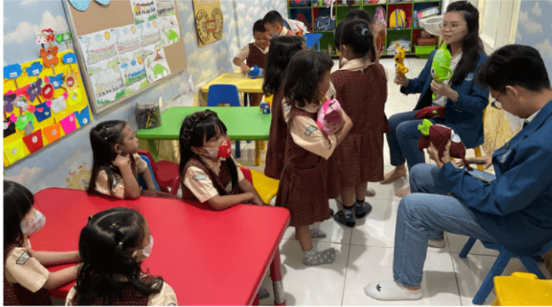
Gambar 4. Aktivitas Panggung Boneka Virus Keuangan

Melalui cerita dongeng tersebut, penulis dapat melakukan pengenalan dasar dari karakteristik hidup boros serta dampak negatif pada kehidupan mendatang. Peran mahasiswa pelaksana dalam dongeng ini dibagi menjadi dua, yakni satu orang mahasiswa berperan sebagai narator, dan dua mahasiswa lainnya memerankan sesuai dengan karakter boneka . Di sela-sela pelaksanaan panggung boneka, anak-anak aktif bertanya mengenai cerita dan karakter-karakter virus keuangan yang dibawakan yang menandakan mereka bersemangat. Harapannya, karakter dan pelajaran yang didapat dari panggung boneka dapat lebih dimengerti dengan bantuan alat peraga serta mendorong siswa-siswi untuk menghindari gaya hidup konsumtif.