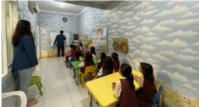
Gambar 11. Mengajari anak-anak cara berhitung

Aktivitas terakhir pada pengabdian masyarakat adalah mengajari anak-anak cara berhitung. Aktivitas ini juga dilakukan pada hari terakhir dengan permintaan dari anak-anak TK Ceria sendiri. Pengajaran dasar tentang cara berhitung merupakan pondasi penting dalam pendidikan keuangan anak-anak. Dengan memahami konsep-konsep dasar matematika seperti penjumlahan dan pengurangan, anak-anak dapat mengembangkan keterampilan dasar yang diperlukan untuk mengelola uang secara efektif di masa depan. Metode pengajaran yang interaktif dan menyenangkan, dapat membantu meningkatkan minat dan pemahaman anak-anak dalam belajar berhitung. Dalam aktivitas ini, anak-anak juga terlihat sangat antusias dan aktif menjawab setiap soal yang ditanyakan.