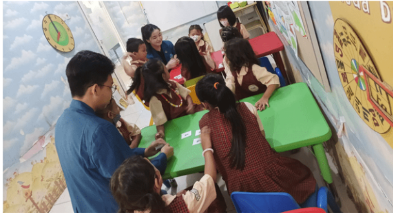
Gambar 6. Kartu kembar virus keuangan dengan metode secara berkelompok

Permainan kartu kembar virus keuangan merupakan permainan mencocokkan kartu, dimana para pemain diharuskan untuk mencocokkan sebanyak 22 kartu yang tertutup dan disebarakan secara acak. Dalam permainan ini, siswa-siswi TK dapat mencari pasangan yang sama dari kartu kembar dan dilakukan secara bergantian dalam satu kelompok. Pemenang dari permainan ini ditentukan melalui kelompok yang berhasil paling cepat mencocokkan seluruh kartu yang disediakan. Tujuan permainan kartu kembar ini untuk mengasah ketelitian siswa-siswi melalui gambar virus keuangan, serta melatih daya ingat yang nantinya akan berguna di kemudian hari.