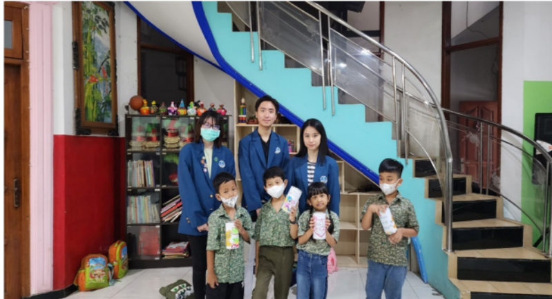
Gambar 4. Kegiatan Mengajar oleh Para Mahasiswa

Reaksi anak-anak juga menjadi salah satu sinyal untuk menguji kepuasan mereka terhadap kunjungan yang dilakukan oleh para mahasiswa. Rata-rata anak menunjukkan ekspresi senang dan bersemangat ketika para mahasiswa mengunjungi mereka. Hal ini terlihat dari antusiasme dan nada bicara mereka yang bersemangat menyapa para mahasiswa di pagi hari. Mereka juga secara aktif bertanya kapan kedatangan kembali para mahasiswa untuk pertemuan selanjutnya. Di hari terakhir pertemuan, para siswa TK B Rainbow Kiddy merasa sedih dengan perpisahan tersebut. Hal ini menunjukkan bahwa kunjungan yang dilakukan oleh para mahasiswa berdampak signifikan. Mereka juga menunjukkan rasa terima kasih atas materi yang diberikan oleh para mahasiswa kepada mereka.