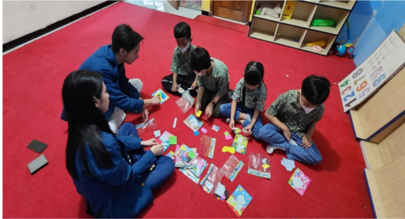
Gambar 3. Kegiatan Mengajar oleh Para Mahasiswa

Reaksi anak-anak juga menjadi salah satu sinyal untuk menguji kepuasan mereka terhadap kunjungan yang dilakukan oleh para mahasiswa. Rata-rata anak menunjukkan ekspresi senang dan bersemangat ketika para mahasiswa mengunjungi mereka. Hal ini terlihat dari antusiasme dan nada bicara mereka yang bersemangat menyapa para mahasiswa di pagi hari. Mereka juga secara aktif bertanya kapan kedatangan kembali para mahasiswa untuk pertemuan selanjutnya. Di hari terakhir pertemuan, para siswa TK B Rainbow Kiddy merasa sedih dengan perpisahan tersebut. Hal ini menunjukkan bahwa kunjungan yang dilakukan oleh para mahasiswa berdampak signifikan. Mereka juga menunjukkan rasa terima kasih atas materi yang diberikan oleh para mahasiswa kepada mereka.