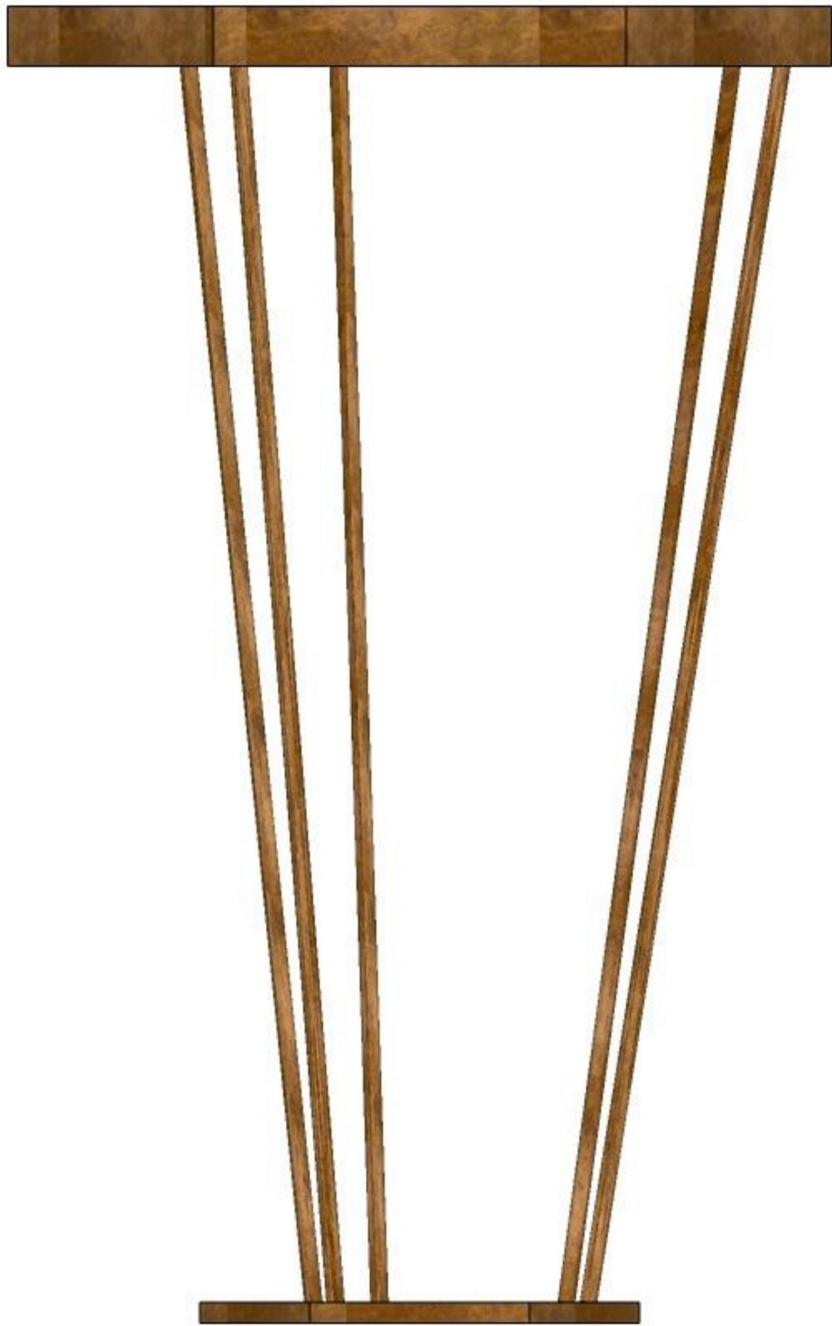
Gambar 5 - Tampak Belakang