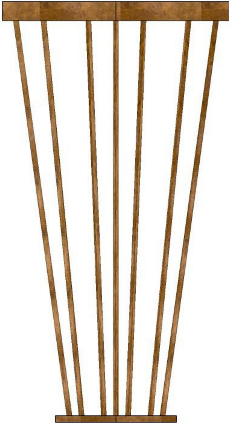
Gambar 6 - Tampak Samping Kiri