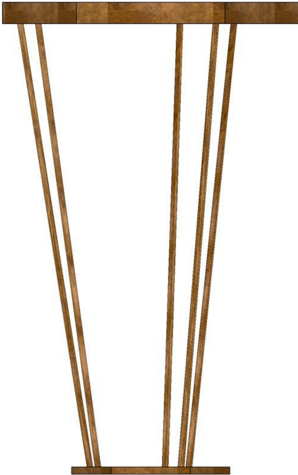
Gambar 4 - Tampak Depan