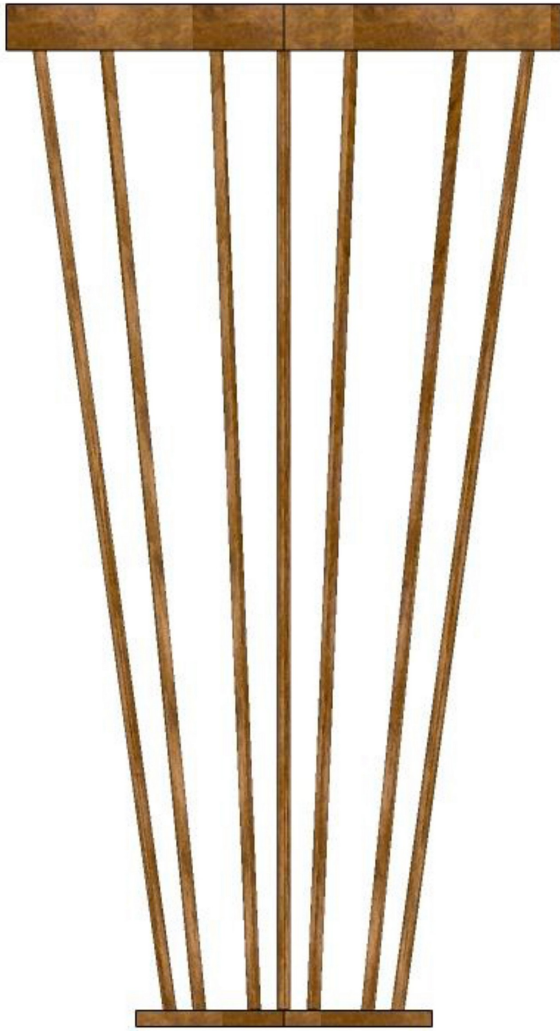
Gambar 7 - Tampak Samping Kanan