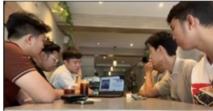
Gambar 2. Presentasi Mitra

Mitra mengapresiasi kedalaman dan kualitas analisis yang disajikan, serta rekomendasi teknis yang applicable. Mitra juga menunjukkan ketertarikan pada strategi menghadapi persaingan harga dari rental PS yang sudah ada dan kekhawatiran penggunaan hutang yang tinggi. Mitra juga menambahkan pemisahan ruangan antara smoking dan non smoking area.