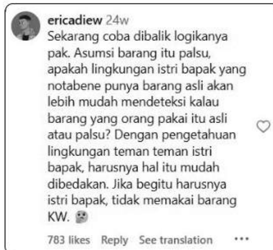
Gambar 4 Pendapat Warganet tentang Kelompok Sosial Hariyanto dan Adrias (Kumparan, 2023b)

Argumen menarik lainnya dapat dilihat dari bagaimana seorang warganet secara spesifik memaknai alasan Hariyanto dalam konteks kelompok sosialnya. Hal ini dapat dicermati lebih jauh dalam komentar panjang lebar seputar kelas para pejabat dalam gambar di bawah ini (Gambar 4).