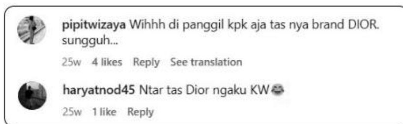
Gambar 5 Komentar Warganet terhadap Vidya yang Merujuk Kasus Hariyanto (Berita Satu, 2023)