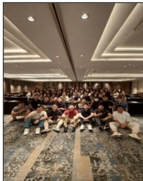
Gambar 103. Sesi dengan Business Owner yang Merupakan Anggota APKRINDO

Terlaksananya sesi – sesi dengan para member APKRINDO, yaitu kombinasi dari para pebisnis senior dan pebisnis muda yang memberikan insight – insight dalam memulai dan mengelola bisnis F&B.