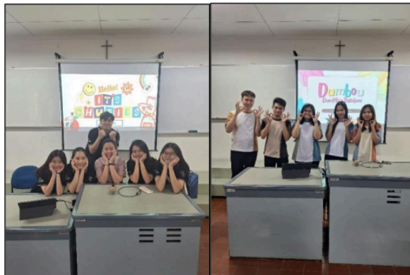
Gambar 108. Presentasi final report

Para mahasiswa membuat report yang dipresentasikan dihadapan 7 panelist untuk berdiskusi terkait apa yang telah dikerjakan dalam project yang telah dilalui.