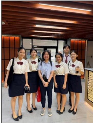
Gambar 105. Sesi Mentoring dengan Para Coach