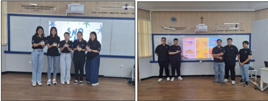
Gambar 106. Presentasi Proposal Proyek