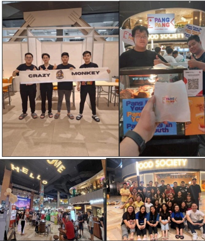
Gambar 107. Penjualan onsite di PCU dan Food Society, Pakuwon Mall Surabaya