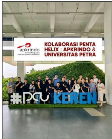
Gambar 101. Event Bersama APKRINDO

Terlaksananya meeting dengan APKRINDO dimana dari meeting tersebut menghasilkan kesepakatan bahwa APKRINDO akan memberikan support pada entrepreneurship program yang akan diadakan oleh Hotel Management program PCU.