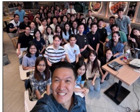
Gambar 104. Sesi Bersama Direktur BOGA Group Jatim

Milestone 3: Creating a business proposal