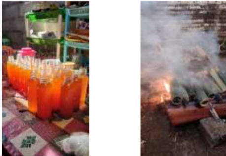
(b) Kuliner khas Desa Jarak