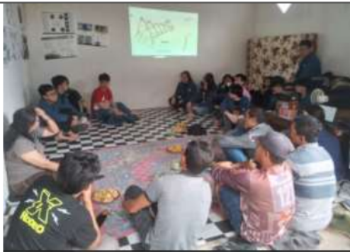
Gambar 4. Foto kegiatan public hearing 2

Setelah public hearing kedua dilaksanakan, Pengabdian dan para mahasiswa sama-sama menjalani rute track kembali, untuk memastikan kondisi track, memastikan keterbanguan desain yang telah dipilih melalui pengukuran yang lebih akurat pada site dan track.