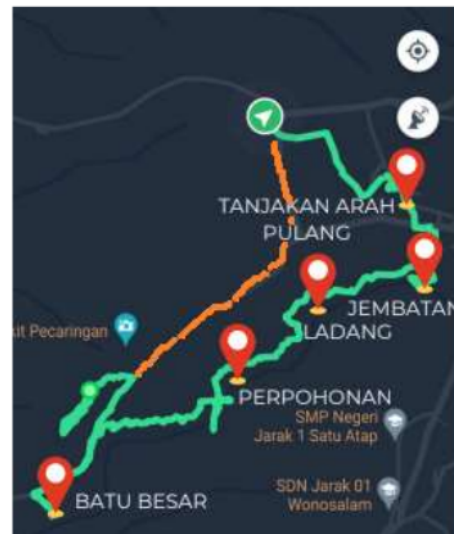
Gambar 7. Rute wisata lintas desa

Berdasarkan survey bersama oleh pengabdian, mahasiswa dan anggota kelompok sadar wisata didapatkan rute sebagai yang terlihat di gambar 7. Rute berawal dari Bukit Pecaringan, memasuki jalan setapak, menuruni tebing (jalur hijau), menyusuri Sungai, mendaki tebing, Kembali ke pecaringan (jalur orange).