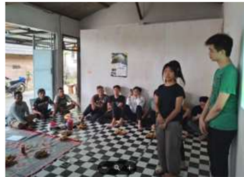
Gambar 4. Foto kegiatan Public Hearing 1

merumuskan rute wisata lintas desa, menetapkan perletakan gazebo, mendesain jembatan. Gambar dan desain yang dihasilkan dipresentasikan kepada Perangkat Desa dan Kelompok Sadar Wisata untuk didiskusikan dan diberi masukan – masukan dari Masyarakat desa, untuk selanjutnya dapat dibawa pada tahap pengembangan desain ( public hearing ). Gambar 4. adalah foto pelaksanaan public hearing pertama.