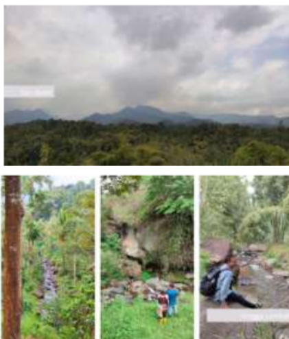
Gambar 1. Pemandangan alam Desa Jarak

3 Di lain pihak, Desa Jarak merupakan sebuah desa di kaki Gunung Anjasmoro, Kecamatan Wonosalam, Kabupaten Jombang. Desa Jarak merupakan desa yang subur, sejuk dan memiliki pemandangan yang indah: lembah hijau, harumnya bunga kopi yang sedang mekar, air terjun dan sungai yang bening. Lokasi Desa Jarak berada di kaki Gunung Anjasmoro, tepatnya 482 m dari permukaan laut, sehingga suhu cenderung sejuk, berkisar antara 25-28 o C. Desa ini memiliki segudang potensi, utamanya adalah lokasinya yang diantara bukit – bukit, pemandangan alam indah yang masih asli, penduduk yang ramah dan aktivitas pariwisata camping ground serta paket wisata lintas desa ( trekking ) yang sudah ada namun kurang terbina.