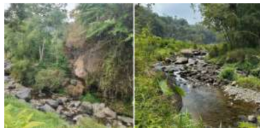
Gambar 8. Kiri: Watu lumbung, Kanan: Sungai

Dalam perjalanannya wisatawan akan menemui beberapa pemandangan yang berbeda-beda. Seperti yang dapat dilihat di Gambar 8-kiri, Ada batu besar yang oleh masyarakat lokal diberi nama Watu Lumbung (Batu Lumbung). Setelah itu wisatawan akan menyusuri tepian sungai (gambar 7-kanan). Kemudian gambar 9. Menunjukkan rute selanjutnya yaitu area hutan sengon, yang kemudian perjalanan akan melewati hamparan ladang terbuka, hingga pada suatu titik wisatawan akan diajak melintasi sungai dengan meniti jembatan bambu. Jembatan inilah yang akan didesain ulang agar tampak lebih estetik dan instagramable . Berikut adalah foto beragam pemandangan yang dapat dinikmati pada rute wisata lintas desa.