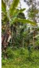
Gambar 6. Kondisi rute track Panjang

Selanjutnya, survei track pendek dilakukan bersama mahasiswa. Pada survei ini, reaksi mahasiswa, yang sebagian besar belum pernah melakukan trekking juga menjadi umpan balik dalam penentuan rute.