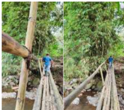
Gambar 10. Kondisi eksisting jembatan

Mahasiswa mendampingi mitra untuk membuat desain jembatan bambu yang secara konstruksi mudah dibangun, namun memiliki nilai estetika yang menarik.