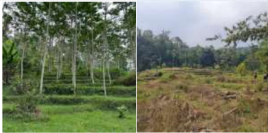
Gambar 9. Kiri: Hutan sengon, Kanan: ladang