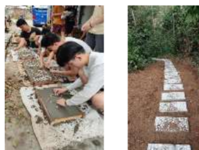
(b) Perbaikan Perkerasan