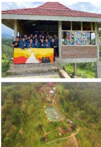
Gambar 2. Pengembangan fasilitas camping di Bukit Pecaringan yang telah dilakukan sebelumnya

komunitas. Beberapa kegiatan yang terjadi adalah acara camping dari komunitas mobil seperti: Mobil IGNIS, Mobil Mazda, Mobil Carry, acara outbond dan persami oleh murid-murid sekolah, dan berbagai aktivitas lain yang mengundang minat masyarakat dari luar Wonosalam untuk berkunjung ke tempat ini. Namun seperti yang diungkapkan oleh Audyarizki, 2022, bahwa kegiatan wisata di Bukit Pecaringan masih perlu dikembangkan. Salah satu hal yang dapat dikembangkan adalah pengkayaan aktivitas, untuk mengisi waktu selama camping dilaksanakan, hingga dari waktu ke waktu, para pengunjung memiliki pilihan kegiatan, selain bersantai dan menikmati pemandangan yang cantik dari atas bukit.