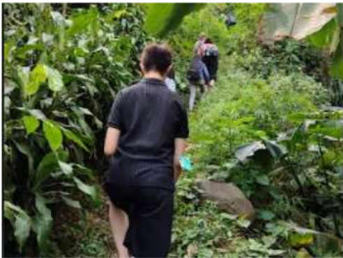
Gambar 3. Foto kegiatan survey lintasan

Survei rute trekking ini dilaksanakan dua kali, untuk mempertimbangkan keberagaman wisatawan yang akan mengikuti rute. Dari hasil survey bersama, mahasiswa akan membantu