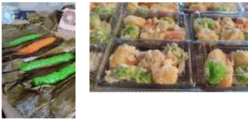
(a) Kemasan awal dan kemasan masukan yang lebih mudah untuk dibawa