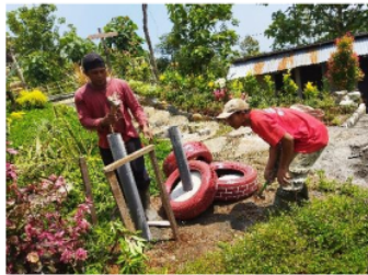
Gambar 6. Tim mitra menyiapkan tiang penyangga wastafel.

Sementara Pada Hari Selasa tanggal 20 April 2021, Tim mitra menyiapkan tiang penyangga wastafel yang dibuat dari pralon yang ditanam dan di cor semen dengan penguat tulangan besi diameter 10mm. Gambar 6 adalah foto Tim mitra membuat tiang penyangga wastafel.