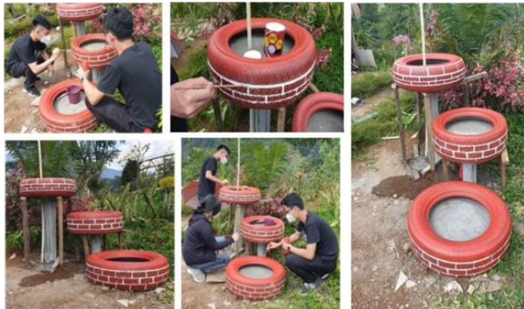
Gambar 7. Merapikan cat setelah wastafel terpasang

Pada tahap konstruksi wastafel diletakkan pada tatakan yang sudah disiapkan. Pada Hari Rabu 21 April 2021, Tim mahasiswa belajar mewujudkan hasil desainnya dan berkerja bersama Tim mitra menyelesaikan wastafel. Gambar 7 Foto saat mahasiswa merapikan cat yang tergores dan mengelupas saat pengangkutan ke lokasi dan foto hasil karya wastafel ban bekas.