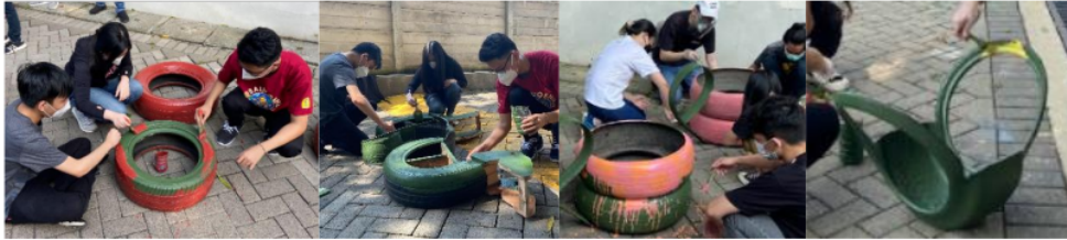
Gambar 5. Tim mahasiswa mengecat ban bekas yang akan dipakai