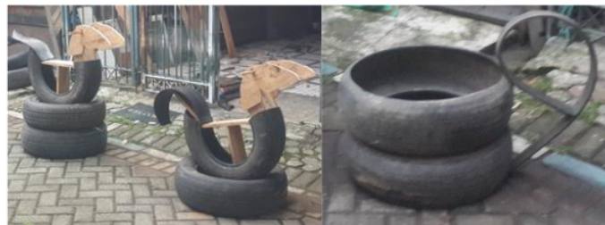
Gambar 4. Kuda-kudaan dan pot dari ban bekas

Biaya yang dibutuhkan untuk wastafelnya saja adalah sebesar seratus sembilan puluh ribu rupiah, tidak termasuk besi koral dan pasir serta papan bekesting yang sudah tersedia di lokasi. Serta instalasi 74 per besi dan air buangan yang menggunakan pipa yang sudah disediakan oleh mitra. Rincian dapat dilihat pada Tabel 1.