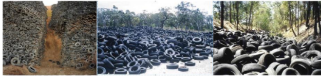
Gambar 1. Tumpukan ban bekas diperbagi tempat

karena itu jumlah ban bekas akan semakin menumpuk. Gambar 1. menunjukkan beberapa foto yang menunjukkan tumpukan ban bekas diberbagai tempat.