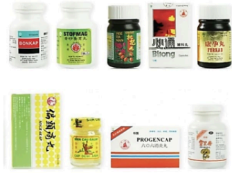
Gambar 6. Kemasan produk Sinar Herba Radix

Pada produk obat herbal Cina, hampir semua nama produk ditulis menggunakan aksara Cina. Ada yang disertai dengan huruf alfabet latin, namun ada pula yang tidak. Mengingat tidak semua konsumen Indonesia dapat membaca aksara Cina, maka tingkat keterbacaan produk jadi lebih rendah dibandingkan dengan kemasan yang disertai dengan huruf alfabet latin.