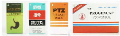
Gambar 8. Elemen garis pada kemasan produk Sinar Herba Radix

Penataan tipografi pada kemasan produk Sinar Herba Radix di dominasi dengan layout center alignment sehingga desain keseluruhan cenderung simetris. Desain yang simetris menimbulkan kesan statis dan seimbang (Poulin, 2018). Elemen grafis pada kemasan produk Sinar Herba Radix antara lain garis, bentuk geometris dan organik, pattern, ilustrasi dan foto. Elemen garis yang digunakan hampir semuanya berorientasi horizontal dan dipasangkan dengan bentuk geometris atau ilustrasi sederhana. Garis horizontal memiliki karakter tenang dan diam, sehingga penambahan elemen garis membuat desain kemasan tetap minimalis dan tidak berlebihan (Poulin, 2018).