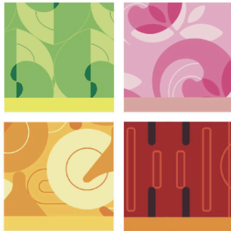
Gambar 13. Konsistensi pattern kemasan Sinargi

Pattern dengan warna mencolok di tengah bidang polos (putih) menjadi fokus utama pada kemasan. Pattern terdiri dari rangkaian grafis semi-abstrak dengan gaya desain flat yang memvisualisasikan karakter tiap produk. Misalnya produk varian Astramuno yang berkhasiat untuk menjaga daya tahan tubuh digambarkan dengan pattern grafis organik yang bentuknya menyerupai tameng. Setiap pattern antar varian tetap mempertahankan konsistensi dengan menggunakan filled shape dan outlined shape . Kombinasi warna yang digunakan terdiri dari warna yang bersebelahan dalam color wheel dan memiliki perbedaan minimal kromatik. Kombinasi ini biasa disebut dengan kombinasi analogus (Poulin, 2018). Warna-warna dalam satu analogus menciptakan sebuah harmoni dengan yang menenangkan (Cugelman, 2020).