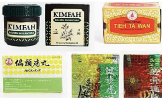
Gambar 10. Elemen pattern pada kemasan produk Sinar Herba Radix

Pada kemasan produk Sinar Herba Radix, beberapa pattern diaplikasikan sebagai bagian dari grafis (dicetak pada kemasan), namun ada pula yang digunakan sebagai tekstur (menggunakan kertas yang diberi finishing khusus seperti laminasi atau emboss dan deboss sehingga menghasilkan tekstur pattern saat diraba dengan tangan).