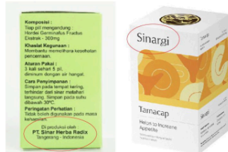
Gambar 16. Nama brand pada kotak kemasan produk Sinar Herba Radix & Sinargi Sumber: dokumen olahan penulis

Meskipun terdapat beberapa desain kemasan yang minimalis, namun citra tradisional tetap melekat pada kemasan produk Sinar Herba Radix karena sebagian besar kemasan masih mengadaptasi gaya desain grafis tradisional.