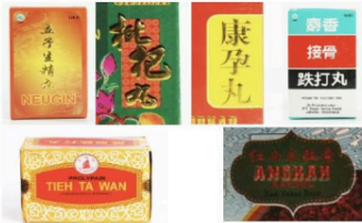
Gambar 9. Elemen bentuk geometris dan organik pada kemasan produk Sinar Herba Radix

Elemen bentuk geometris dan organik tidak berfungsi sebagai fokus utama pada kemasan, melainkan hanya sebagai hiasan pada background , atau memberikan highlight pada elemen lain yang tumpang tindih di atasnya. Elemen organik tidak abstrak, namun berupa outline ornamen meliuk-liuk yang membentuk seperti gambar tanaman.