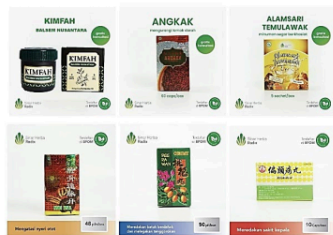
Gambar 19. Template etalase marketplace Sinar Herba Radix

Sinar Herba Radix memanfaatkan platform Tokopedia untuk menjual produk-produknya secara online . Sejauh ini, Sinar Herba Radix memiliki 23 varian produk pada etalase toko mereka. Pengunjung dapat melihat tampilan asli dari produk yang dijual berkat gambar pada etalase toko. Produk-produk yang ditampilkan dimasukkan ke dalam template dengan sistem desain yang konsisten. Ada dua jenis template yang dimiliki Sinar Herba Radix, seperti pada gambar di bawah ini.