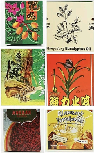
Gambar 11. Elemen ilustrasi dan foto pada kemasan produk Sinar Herba Radix

merepresentasikannya adalah warna merah, biru, hijau, dan kuning. Warna-warna tersebut umum dijumpai pada artefak-artefak Cina kuno seperti guci, teko, mangkuk, dan lain-lain sehingga memiliki hubungan yang erat dengan citra tradisional (Ren, 2013). Kemasan produk Sinar Herba Radix terdiri dari banyak kombinasi warna, mulai dari warna polos hingga bergradasi. Namun warna yang dominan digunakan adalah warna yang merepresentasikan citra tradisional Cina yaitu kombinasi warna merah, kuning, dan hijau.