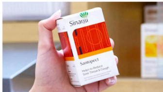
Gambar 14. Hierarki yang tercipta pada teks

Dalam kemasan Sinargi, nama suplemen ditulis menggunakan typeface yang sama dengan typeface logo. Sedangkan text lain berasal dari typeface grotesk family . Typeface grotesk diklasifikasikan kedalam typeface geometris, dimana elemen pembentuk tiap huruf tidak menggunakan bentuk organik namun hanya terdiri dari bentuk-bentuk geometris. Impresi modern dapat dirasakan karena typeface geometris dalam klasifikasi secara umum termasuk typeface yang paling baru. (Lupton, 2010). Karena teks di kemasan Sinargi didominasi oleh typeface sans serif dalam satu family , maka hierarki visual perlu diciptakan. Hierarki visual dapat diciptakan dengan menggunakan typeface lain yang karakternya berbeda. Namun kombinasi typeface yang terlalu banyak akan dan menghilangkan kesan minimalis modern pada kemasan. Untuk itu, desainer tetap menggunakan typeface yang sama namun hierarki visual diciptakan dengan bold , italic , dan variasi ukuran teks. Warna teks di kemasan masih sama seperti warna logo, yaitu abu-abu tua. Namun ada beberapa teks yang value abu-abunya lebih muda untuk menciptakan hierarki visual.