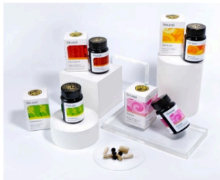
Gambar 12. Kemasan produk Sinargi

Setiap desain kemasan Sinargi terdiri dari logo brand , nama varian produk, pattern, informasi seputar produk, dan logo pelengkap (logo halal, logo jamu, logo Sinar Herba Radix, dan logo Aggi Tjetje).