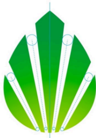
Gambar 2. Detail brandmarks Sinar Herba Radix Sumber: dokumen olahan penulis