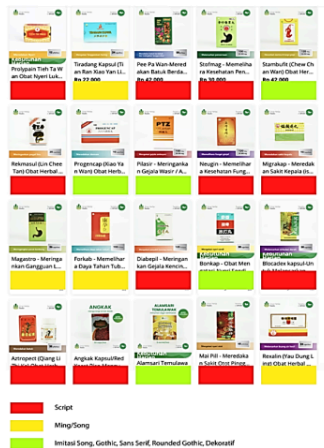
Gambar 7. Pemetaan typeface nama produk Sinar Herba Radix

Dari 20 desain kemasan yang menggunakan aksara Cina pada nama produk, 11 kemasan menggunakan typeface script , 4 kemasan menggunakan typeface Ming/Song , 1 kemasan menggunakan typeface imitasi Song , 3 kemasan menggunakan typeface sans serif , 1 dan kemasan menggunakan typeface dekoratif . Secara keseluruhan, penggunaan typeface yang mengadaptasi karakter kaligrafi dominan sehingga berpengaruh terhadap pembentukan citra tradisional pada brand .