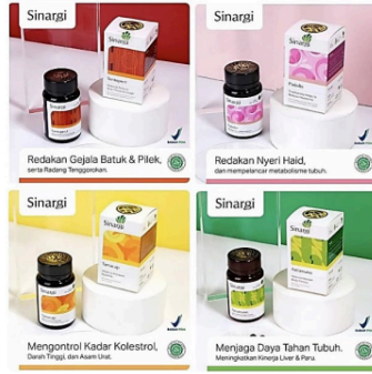
Gambar 20. Template etalase marketplace Sinargi

Desain template etalase marketplace Sinargi lebih bersifat dinamis daripada template etalase marketplace Sinar Herba Radix karena menggunakan layout asimetris. Foto produk juga disusun dengan menggunakan prinsip asimetris. Pada bagian kiri atas, terdapat containing shape putih di bawah logo Sinargi. Pada bagian bawah, terdapat containing shape yang menempel pada dinding kanan desain. Containing shape tersebut memiliki sudut rounded di ujung atas kirinya garis pita di bawahnya. Bentuk dan pita tersebut seragam dengan yang ada pada desain kemasan Sinargi.