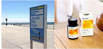
Gambar 18. Perbandingan signage modern & desain kemasan produk Sinergi