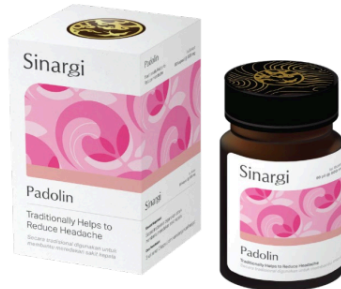
Gambar 15. Sistem desain kemasan Sinargi