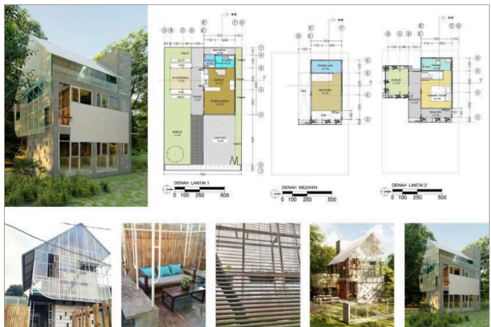
Gambar 4. Rumah tumbuh dengan perancah sebagai elemen struktur fleksibel dan adaptif

Perencanaan yang matang sejak awal sangat penting untuk memastikan kekuatan struktur yang memadai untuk pengembangan di masa depan. Selain memberikan fleksibilitas dalam desain, rumah tumbuh juga meningkatkan nilai properti seiring dengan pertumbuhan dan perubahan kebutuhan keluarga.