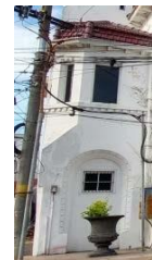
Jendela Gedung Cerutu