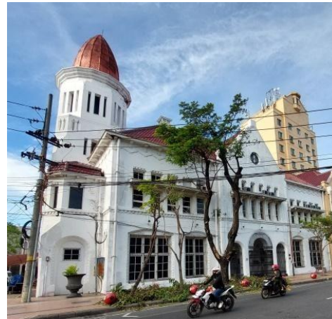
Gambar 2. Bangunan Gedung Cerutu

peradaban barat (Mulyana, 2022). Arsitektur kolonial di Indonesia, sebagai bagian dari kebudayaan kolonialisme terdapat beberapa ciri dan karakteristik umum pada bangunan, diantaranya adanya gavel, ornamen, cipedoma, entrance, gabel, warna, tembok tebal, dan model jendela (Handinoto, 2006). Dari hasil teori yang didapatkan dari beberapa ahli, fasad merupakan elemen penting sebuah bangunan, dikarenakan fasad merupakan wajah serta pembentuk identitas visual maupun karakter utama sebuah bangunan.