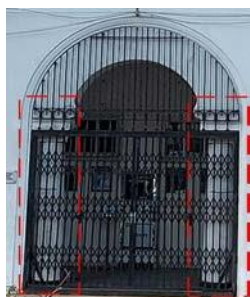
Dinding Gedung Cerutu