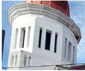
Ornamen Gedung Cerutu

menandakan kemewahan serta otoritas status sosial pemilik bangunan tersebut.