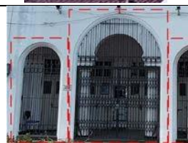
Pintu Besi Gedung Cerutu

Elemen pintu pada bangunan gedung Cerutu, terdapat 2 jenis pintu yang terbuat dari 2 material yang berbeda, untuk pintu luar terbuat dari besi baja, sedangkan pada pintu masuk (bawah), menggunakan material kayu yang