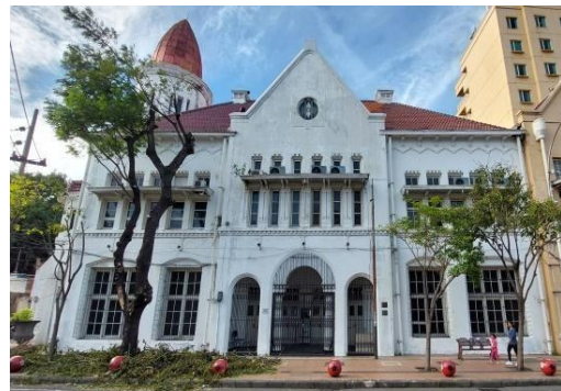
Gambar 1. Bangunan Gedung Cerutu

menjadi kantor Bank Bumi Daya dan juga Kantor Said Bin Oemar pada tahun 1916, sekarang sudah beralih fungsi sebagai gedung kosong yang tidak terdapat aktivitas maupun kegiatan didalamnya.